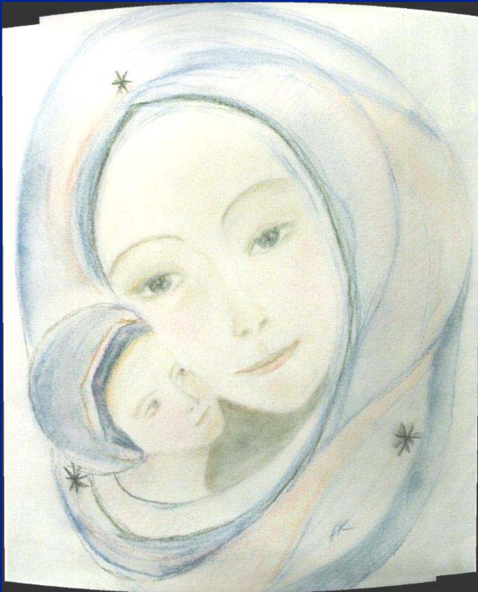
La Vierge bleue